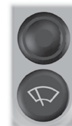
Symbol og knapp for vindusvisker.

Knappen som brukes på samme måte som maskinens originale knapp for aktivering av vindusvisker (ett trykk). Denne knappen har en innebygd forsinkelse og må holdes inne en kort stund for å bli aktivert. (Denne knappen kan også ha en annen funksjon eller være fraværende, avhengig av maskinmodell.)