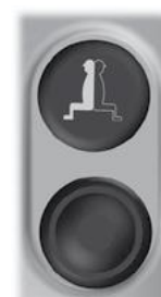
Symbol og knapp for aktivering/deaktivering av systemet.

OBS! Hvis maskinens originalbryter for Frem/Back står i posisjon F (Frem) eller R (Back) når systemet deaktiveres, vil denne bryteren ikke fungere før du først har satt den i posisjon N (Nøytral). Etter at du har satt bryteren i posisjon N (Nøytral), fungerer igjen Frem/back på maskinen som normalt.