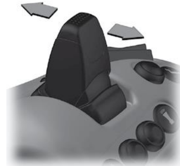
Joystick for styring.

Proporsjonal joystick for å kunne styre maskinen til venstre/høyre. Jo større bevegelse på joysticken, desto raskere styring.