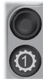
Symbol og knapp for Kick down.

Knappen som kan brukes på samme måte som maskinens originale knapp for kickdown. (Denne knappen kan også ha en annen funksjon eller være fraværende, avhengig av maskinmodell.)