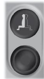
Symbol og knapp for aktivering/deaktivering av systemet.

OBS! Hvis maskinens originalbryter for Frem/Back står i posisjon F (Frem) eller R (Back) når systemet deaktiveres, vil denne bryteren ikke fungere før du først har satt den i posisjon N (Nøytral). Etter at du har satt bryteren i posisjon N (Nøytral), fungerer igjen Frem/back på maskinen som normalt.