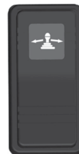
Strømbrytaren EC WS

Når systemet er spenningssatt, skal, i tillegg til joystickkonsollen, også systemets styredatamaskin automatisk være spenningssatt. Styredatamaskinen er plassert i hytten.