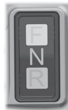
Schakelaar FNR (Fwd/Rev).

3-weg schakelaar om de machines vooruit, achteruit of neutraal te bedienen. In tegenstelling tot de originele schakelaar voor vooruit/achteruitrijden van de machine, is de snelheid van de machine bij gebruik van de FNR-schakelaar op de console van de joystick beperkt tot een max. snelheid van ongeveer 20 km/u.