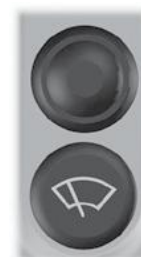
Symbol en knop voor ruitenwisser.

(Deze knop kan ook andere functies hebben, afhankelijk van het machine model)