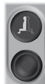
Symbol en knop voor Activeren/deactiveren van het systeem.

Knop voor het activeren van het ExciControl WS systeem (zie "Activeren van het systeem" op pagina 10). Deze knop heeft een ingebouwde vertraging en moet voor enige tijd worden ingedrukt om geactiveerd te worden.