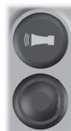
Symbol en knop voor claxon.

(Deze knop kan ook andere functies hebben, afhankelijk van het machine model)