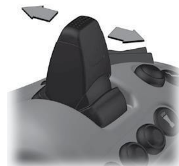
Joystick voor het sturen.

De Joystick-console mag in geen geval worden gebruikt als de beveiliging is beschadigd of verwijderd. Als de beveiliging wordt verwijderd, mag ExciControl WS niet worden gestart of geactiveerd.