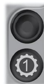
Symbol en knop voor de kick down.

Knop die op dezelfde manier kan worden gebruikt als de originele knop van de machine voor Kick down. (Deze knop kan ook een andere functie hebben, afhankelijk van het machine model.)