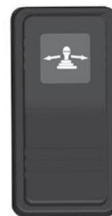
Stroomschakelaar EC WS.

Zodra het systeem wordt ingeschakeld, moet naast de joystick-console ook de hoofdcontroller automatisch worden ingeschakeld. De hoofdcontroller bevindt zich in de cabine.