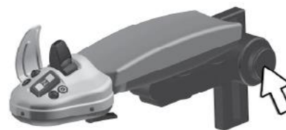
Pulsante per la posizione del bracciolo.

NOTA! Quando ExciControl WS è attivo, la velocità massima della macchina sarà limitata a circa 20 km/h.