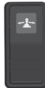
Interruttore di accensione EC WS.

Una volta acceso il sistema, oltre alla console joystick, anche il controller principale deve essere acceso in automatico. Questo si trova nella cabina.