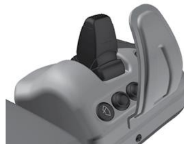
Protezione di sicurezza.

La console joystick non deve mai essere utilizzata se la protezione di sicurezza è stata danneggiata o rimossa. Se la protezione è stata rimossa, ExciControl WS non deve essere avviato né attivato.