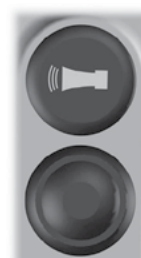
Simbolo e pulsante per il clacson.

Pulsante per attivare il clacson della macchina. (Questo pulsante può anche avere una funzione diversa o mancare, a seconda del modello di macchina.)