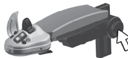
Pulsante per la posizione del bracciolo.

NOTA! Quando ExciControl WS è attivo, la velocità massima della macchina sarà limitata a circa 20 km/h.