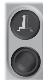
Simbolo e pulsante per attivare/disattivare il sistema.