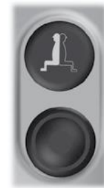
Simbolo e pulsante per attivare/disattivare il sistema.

NOTA! Se l'interruttore originale Marcia avanti/folle/retromarcia è su F (marcia avanti) o R (retromarcia) quando il sistema è disattivato, questo interruttore non funzionerà finché non sarà posizionato su N (folle). Dopo aver selezionato N (folle), l'interruttore Marcia avanti/folle/retromarcia tornerà in funzione.